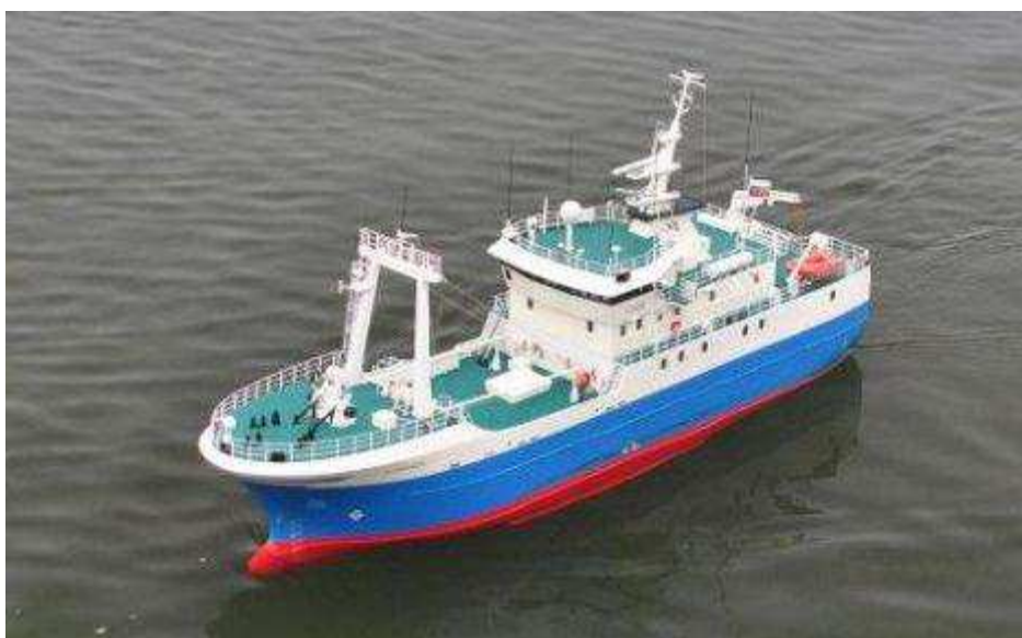
Set ved standerstrygningen