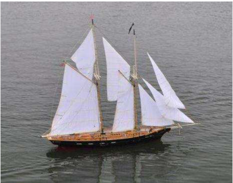
Set ved standerstrygningen