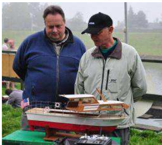
Modellen vurderes nøje af kyndige øjne.