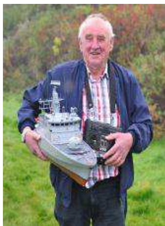
En stolt modelbygger.

Telefon: (+45) 20 33 30 85 Fax: (+45) 36 90 67 17 Mail: aagaard61@hotmail.com www.aagaard61.webbyen.dk