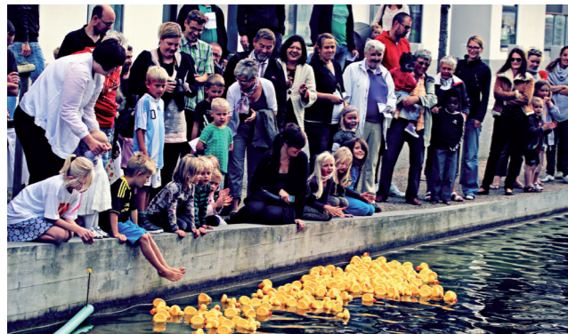
Anderæs fra 2011

Ørestad Kulturdage afholdes i år fra fredag til søndag 31.8-2.9, hvor Ørestad slår dørene op til en lang række kulturelle aktiviteter - fra vandglad Søfest til Open air biograf og fra arkitektoniske oplevelser til streetkultur. Folderen her giver dig et overblik over dagene du kan læse mere om de enkelte arrangementer på www.orestadkultur.dk . Bag Ørestad Kulturdage står Foreningen Ørestad Kultur, som har til formål at være den kulturelle platform for initiativer og arrangementer i og omkring Ørestad.