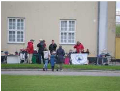
Vi gøre lige klar for at udstille