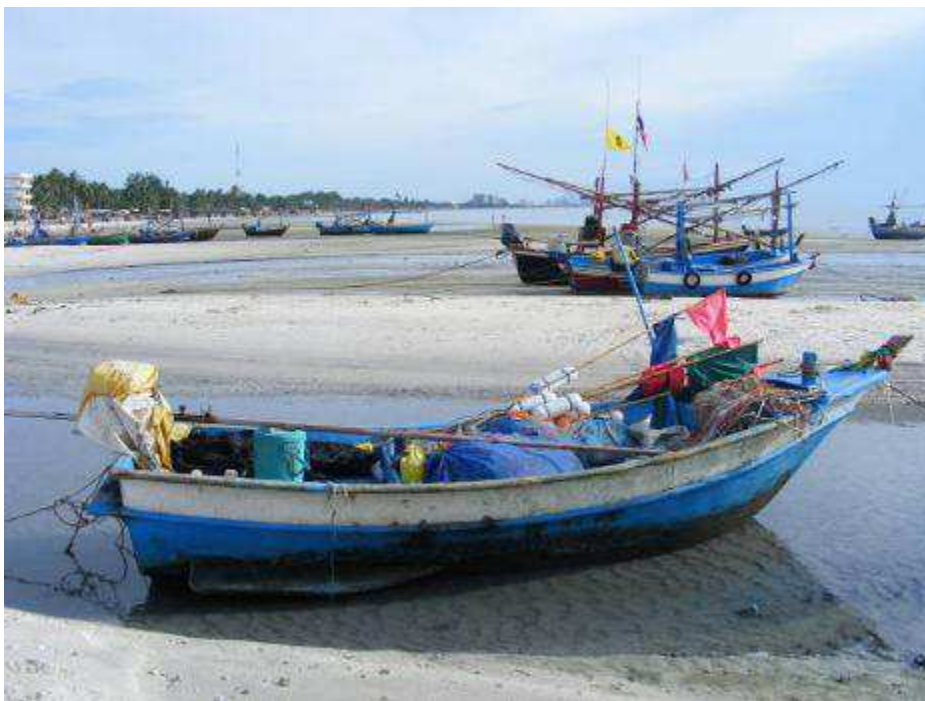
Billed fra Thailand