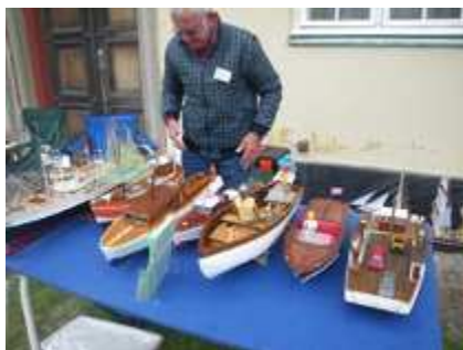
Folmer fra Helsingø klubben

De forsynede os også med mad, lidt kaffe og kage, det hele smagte pragtfuld. Dog var vejret ikke det bedste denne gang og det er mange år siden vi har haft sådan et l...vejr. Men vi fik sejlet alligevel og snakken gik også . Vi ses nok til næste år igen. Her er nogle billeder.