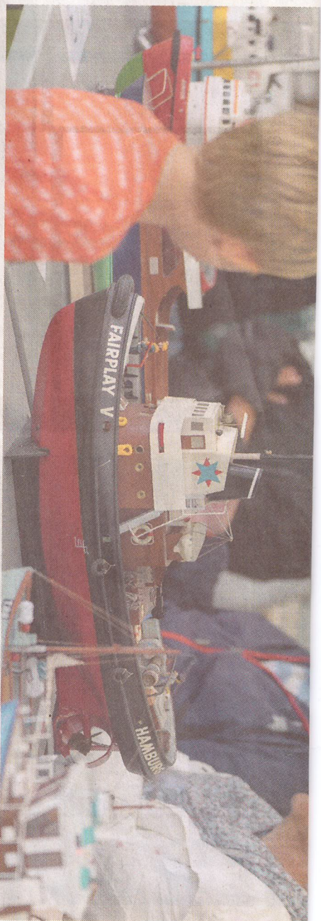
De udstillede modelskibe tiltrak sig meget opmærksomhed.